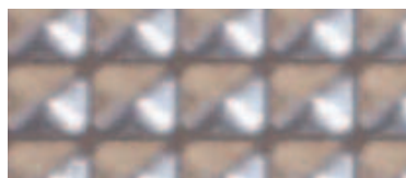
Pointe diamant 208