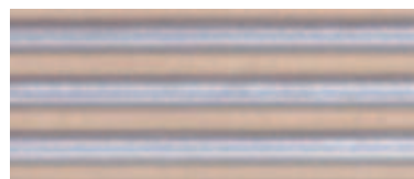
Ondulée 121 T