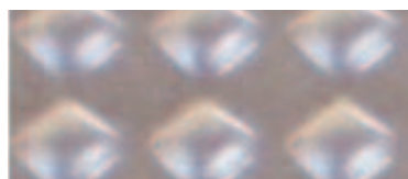
Pointe diamant 209